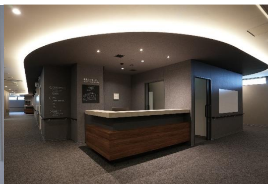
画像診断センター受付