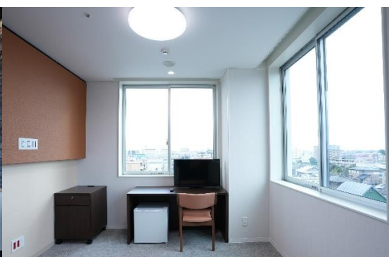
外光を感じる病室